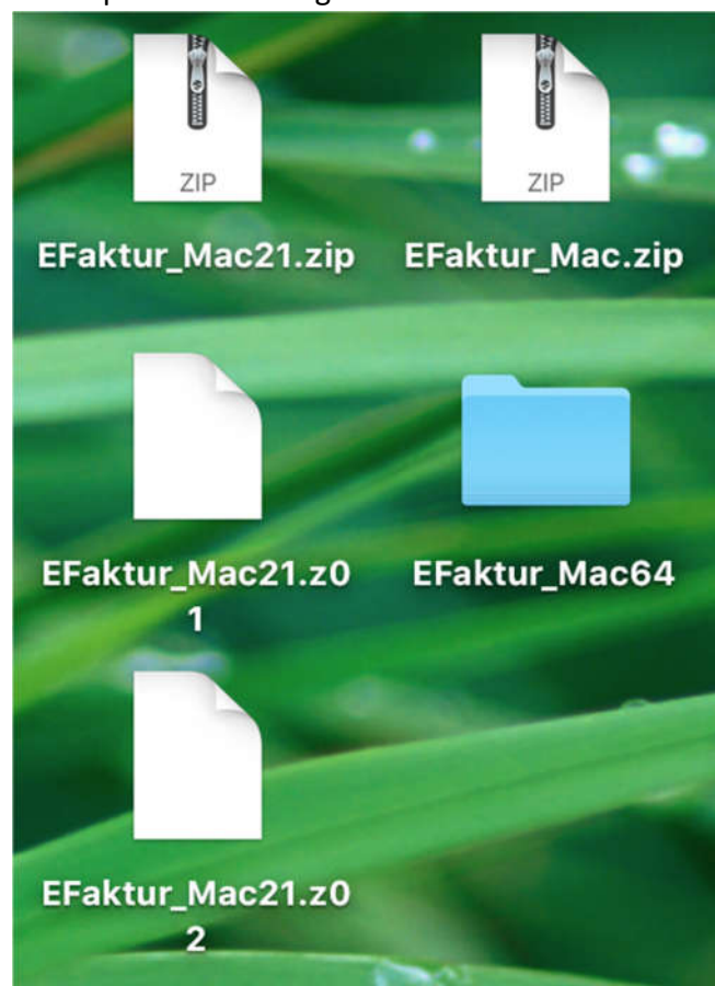
Gb.4 Folder hasil extract