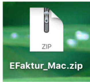
Gb.3 Hasil file yang disatukan