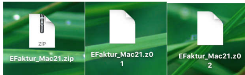
Gb.1 List file update efaktur yang telah berhasil di unduh dan ditempatkan pada satu folder